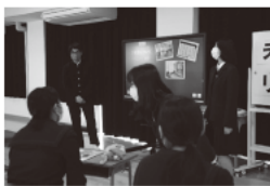
未来リユニオンの様子

毎年、乃木・忌部地区の青少協により開催されている研修会を、KEYSのメンバーが参加し、アイデアを出すことによって中学生・高校生・地域の大人たちがより仲を深められるような内容にして開催しました。アイスブレイクで参加者が打ち解けあった後、グループに分かれて地域に関するテーマから1つを選び、グループごとにまとめて発表しました。初めはみんな緊張している様子でしたが、意見を出し合ううちに地域への考えを深められ、テーマについて新たな視点から考えることが出来ました。発表では中学生が中心となり、参加者の前で堂々と発表していました。