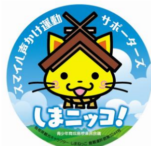
しまニッコ！サポーターズバッジ