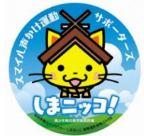
サポーターズバッジ サイズ: 5.5cm