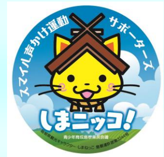
しまニッコ！缶バッジ