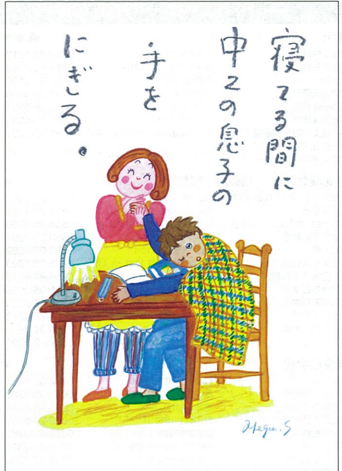
【一般の部】 島根県 浜田市 大岡 美紀 様

青少年育成島根県民会議が発行する冊子等に広告を掲載していただける企業、団体を募集しています。お問い合わせ、お申込みは青少年育成島根県民会議へ。お待ちしております。