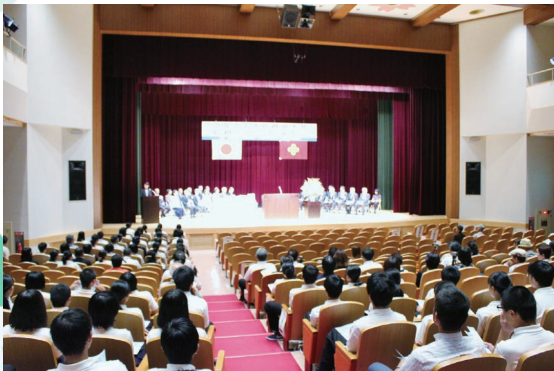
聴衆席風景（前方：来賓及び審査員席）