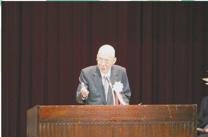
青少年育成島根県民会議会長あいさつ