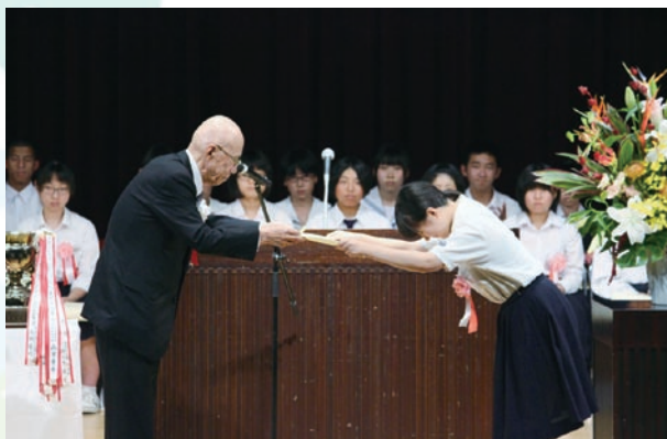
青少年育成島根県民会議会長賞授与