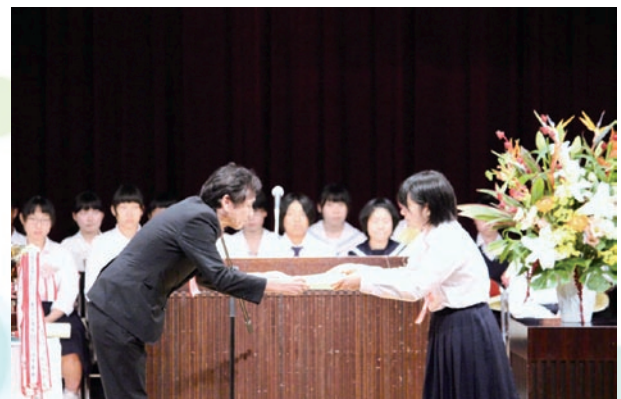
島根県知事賞授与