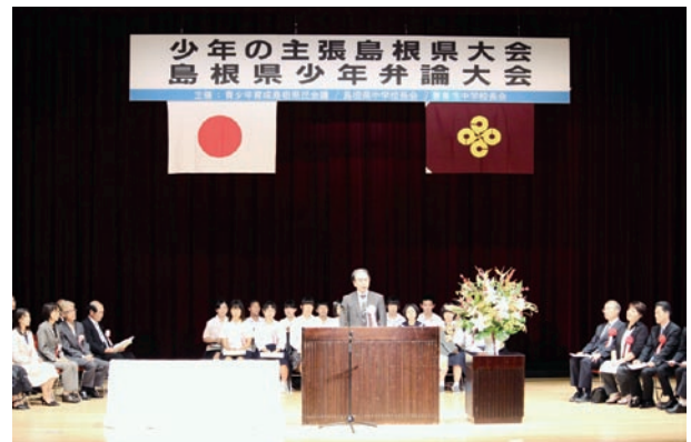
島根県中学校長会長あいさつ