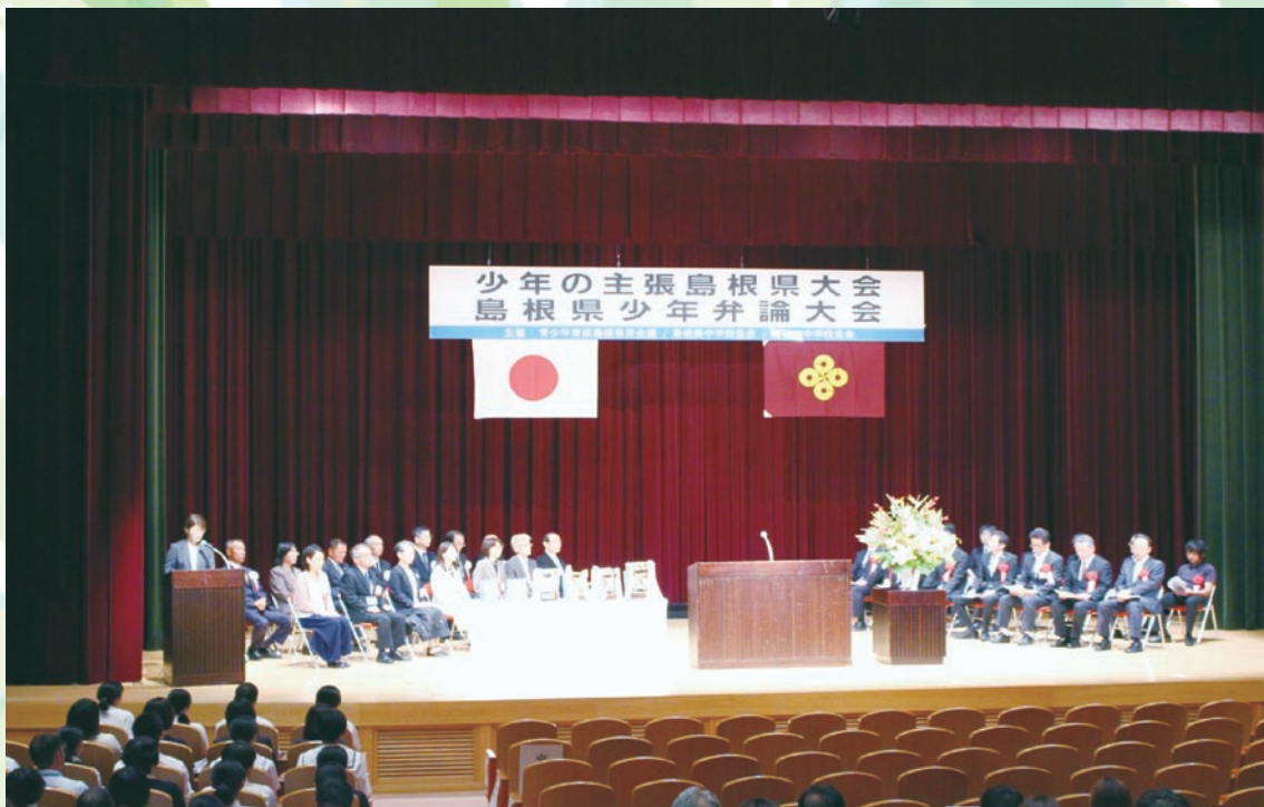
開会式（会場：雲南市木次経済文化会館 チェリヴァホール）