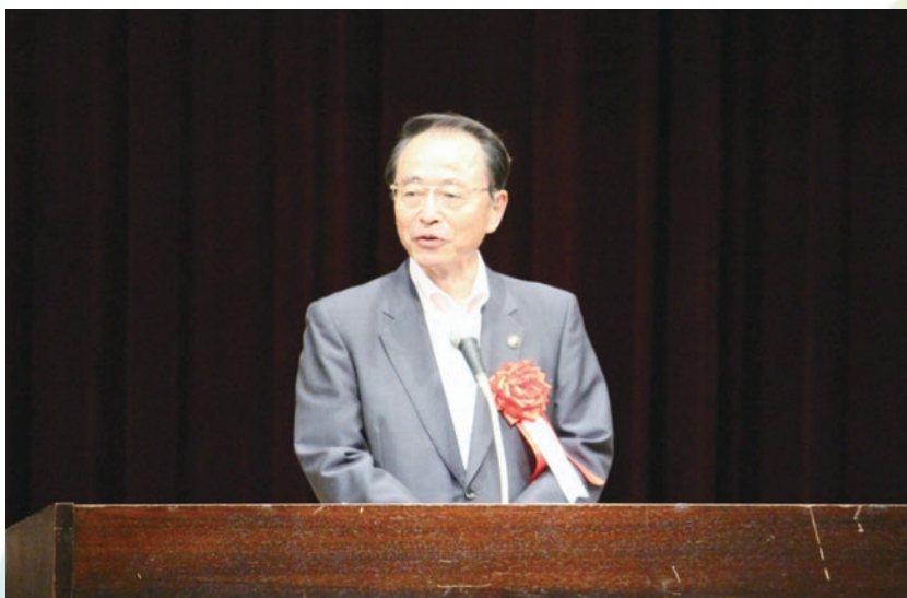
雲南市長あいさつ