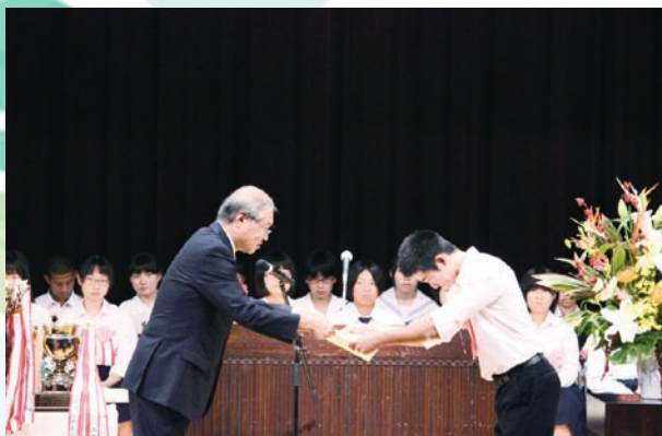
島根県教育委員会教育長賞授与