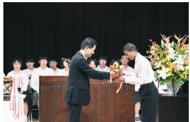
島根県警察本部長賞授与