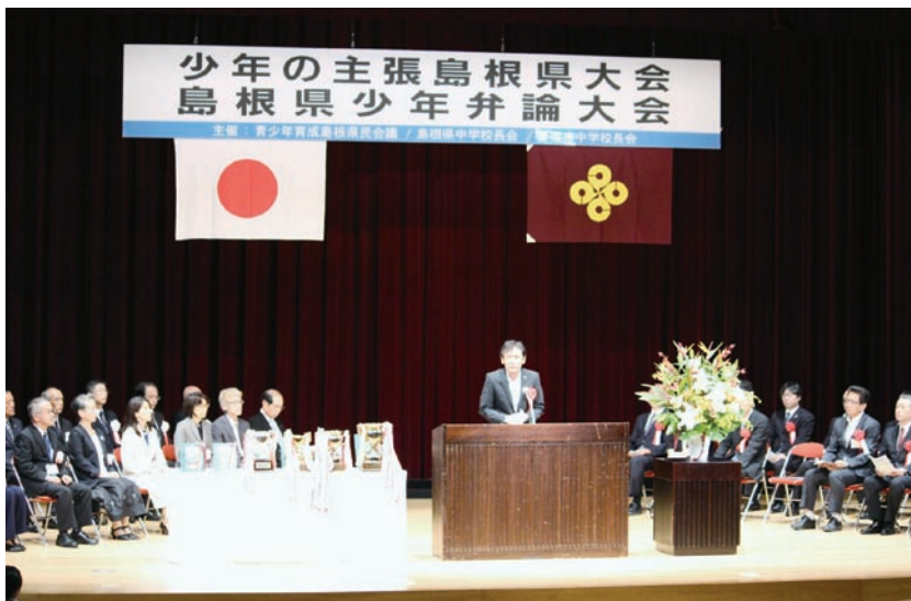
島根県知事あいさつ（代読：出雲児童相談所長）