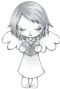
青少年育成島根県民会議キャラクター ハピネス