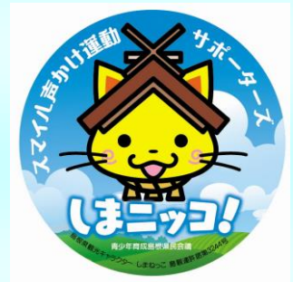
しまニッコ！サポーターズバッジ