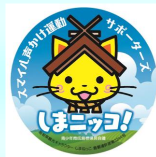
しまニッコ！缶バッジ