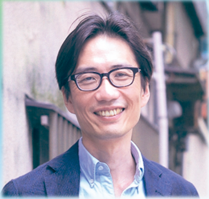
ゆ あ さ ま こと